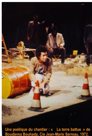
Une poétique du chantier : « La terre battue » de Boudjema Bouhada, Cie Jean-Marie Serreau, 1972.

Serreau en paroles , lecture n°1, extrait de Jean-Marie Serreau , Actes-Sud, 2025